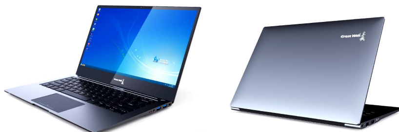
图 1-1 产品外观