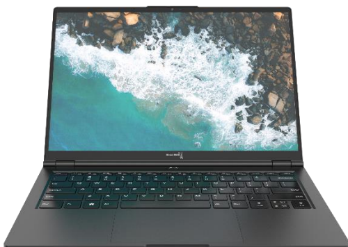
图 1-1 产品外观